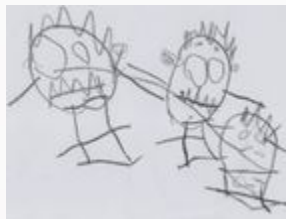
Dessin du bonhomme du mois de septembre