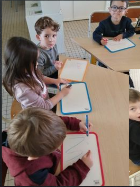
Activités autour du prénom: lettre scripte ou majuscules, écriture, mémoire .