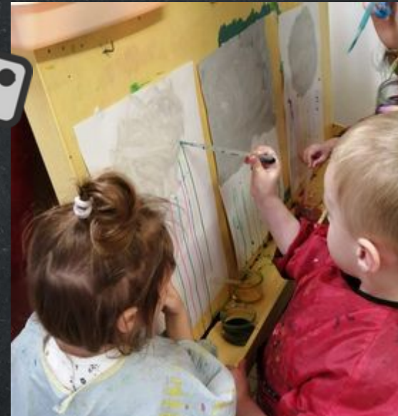
J'observe la verticalité: je fais couler l'encre à partir de mon nuage.