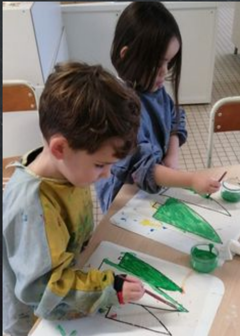
Activités graphiques: les lignes et les traits obliques