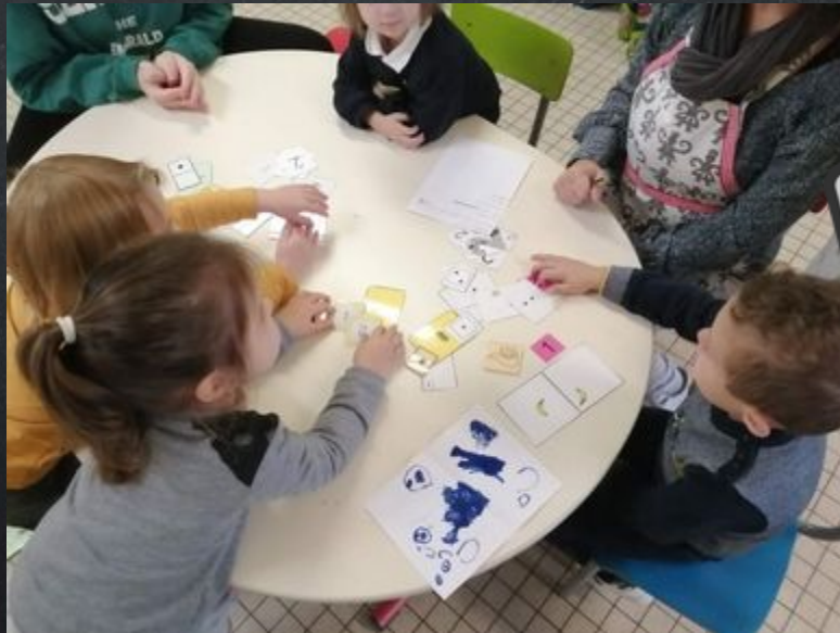
Je cherche tout ce qui fait 1 et 2.