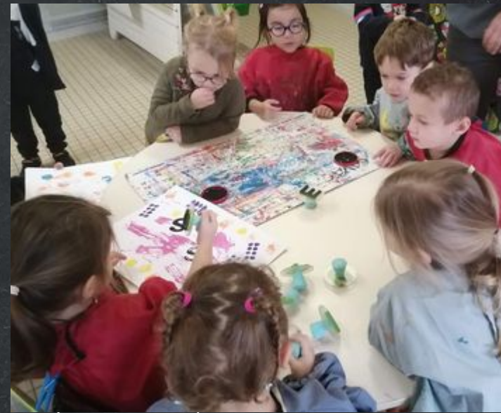
Après avoir trouvé mon initiale, je la tamponne sur mon oeuvre de traces.