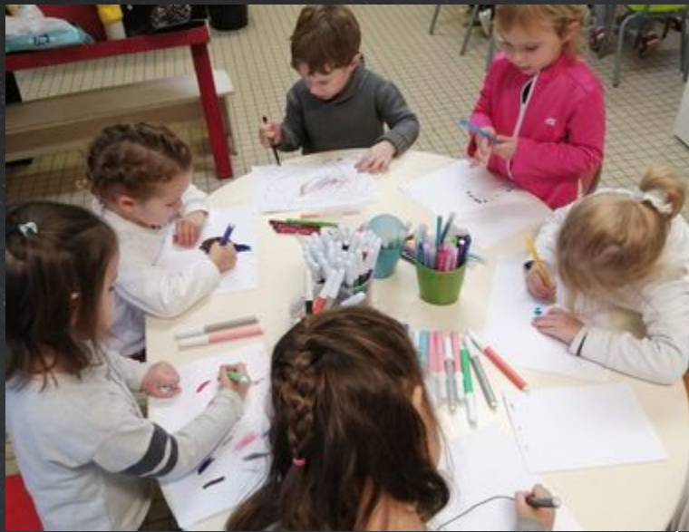
Je dessine puis je nomme ou donne les couleurs utilisées. ATTENTION A LA TENUE DU CRAYON!